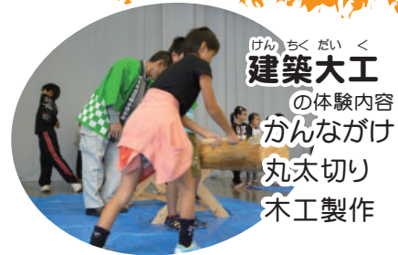
建築大工 の体験内容 がんながけ 丸太切り 木工製作