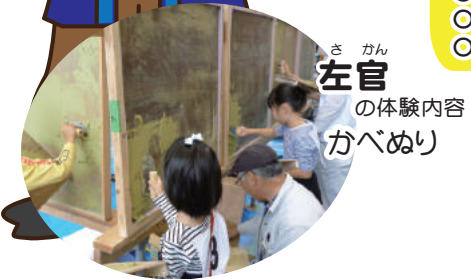
左官 の体験内容 かべめり