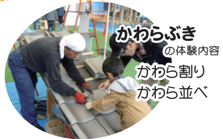
かわらぶき の体験内容 かわら割り かわら並べ