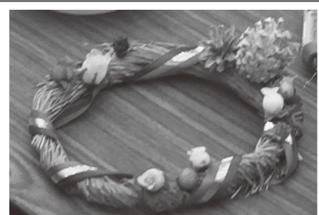
指導:岐阜県畳組合