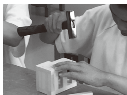
指導:岐阜県建築組合連合会