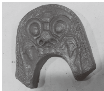
指導:岐阜県瓦葺組合