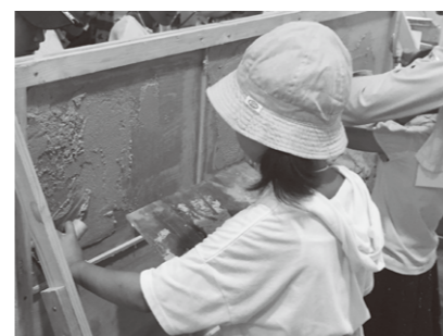
指導:岐阜県左官業組合連合会