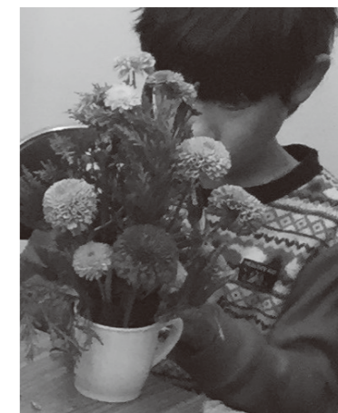
指導:岐阜県フラワー装飾 技能検定協議会